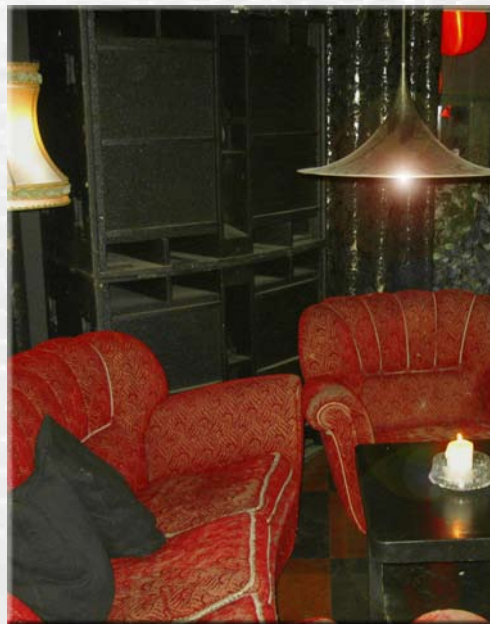
Brukbar i Trondheim. Store subber rett ved byens mest populære sofagruppe;-) 4x18 -tommere...