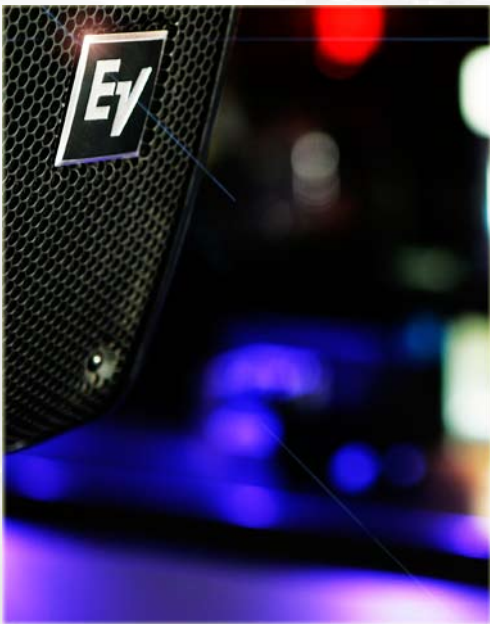
Club Gossip i Trondheim. Komplette lydinstallasjon over 3 plan med mulighet for lyd mellom alle soner.