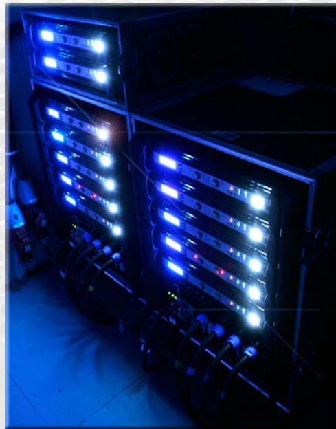
70.000W med forsterkere på Byscenen fra 12stk Electro-Voice TG5/7 i samarbeide med SLL.