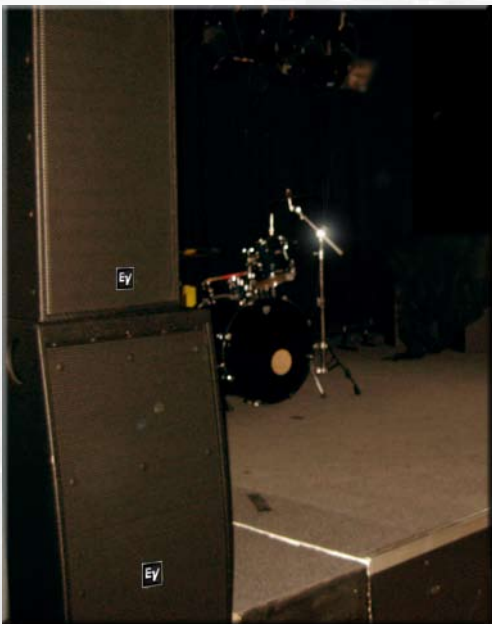
Kultursenteret ISAK's Coffeé Annan i Trondheim. Electro-Voice Xsub, Xi-2123A og CPS 8.5/4.10.