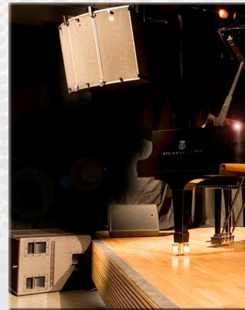
Dokkhuset Scene med L-Acoustics ARCS / SB218 levert og installert i samarbeide med SSAS.

avon as prosjekterer, leverer og installerer lyd-, lys-, scene-, tekstil-, styring- og A/V-systemer til det norske proff-markedet - alt med en lidenskap for detaljer og kvalitet!