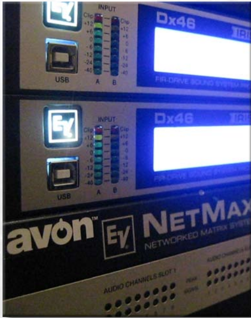
FIR-prosessorer og matrisemiksere fra ElectroVoice sørger for maksimum ytelse av konferanseanlegget