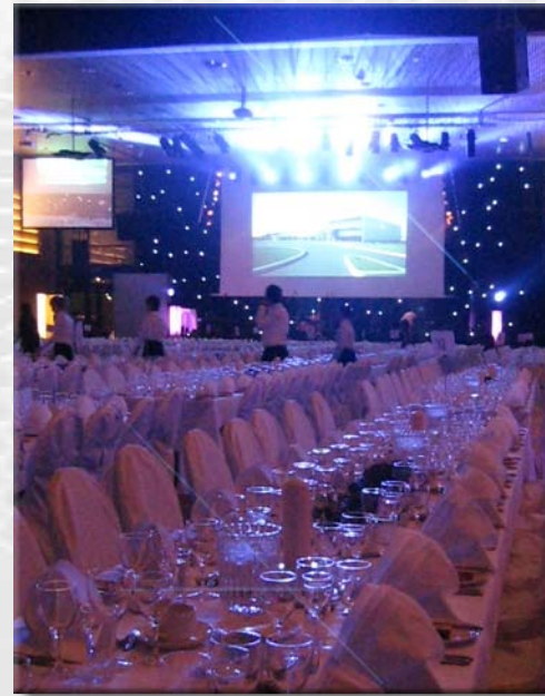
Thon Hotel Arena Lillestrøm har fleksible løsninger med lydanlegg fra Electro-Voice og styring fra AMX