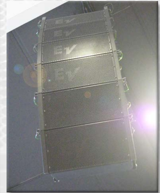
Rosenborg Ungdomsskole har Electro-Voice XLE linearray fra Office i samarbeid med avon as.

avon as prosjekterer, leverer og installerer lyd-, lys-, scene-, tekstil-, styring- og A/V-systemer til det norske proff-markedet - alt med en lidenskap for detaljer og kvalitet!