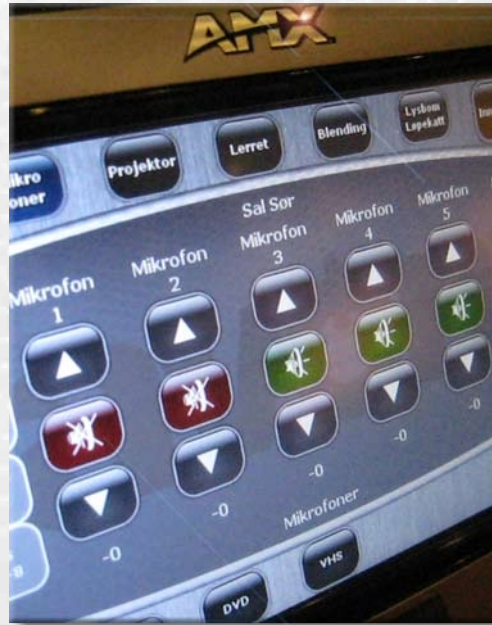
Thon Hotel Arenas "Sør- og Nord-Norge" med AMX berørings-skjermer og veggpaneler sikrer enkelhet.