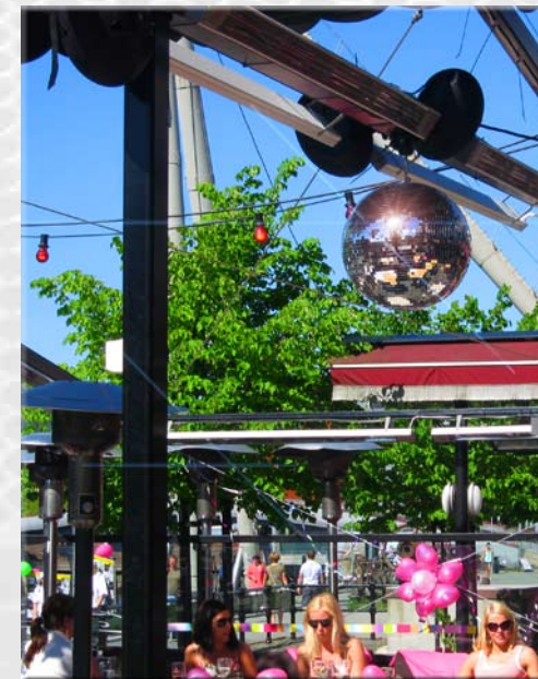
Søstrene Karlsen i Trondheim. Omsetningsøkning etter oppussing og ny lyd våren 2010.

avon as prosjekterer, leverer og installerer lyd-, lys-, scene-, tekstil-, styring- og A/V-systemer til det norske proff-markedet - alt med en lidenskap for detaljer og kvalitet!