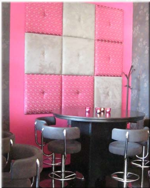
Søstrene Karlsen i Trondheim. Bildet viser spesialbygd bord med integrert basshøytaler.