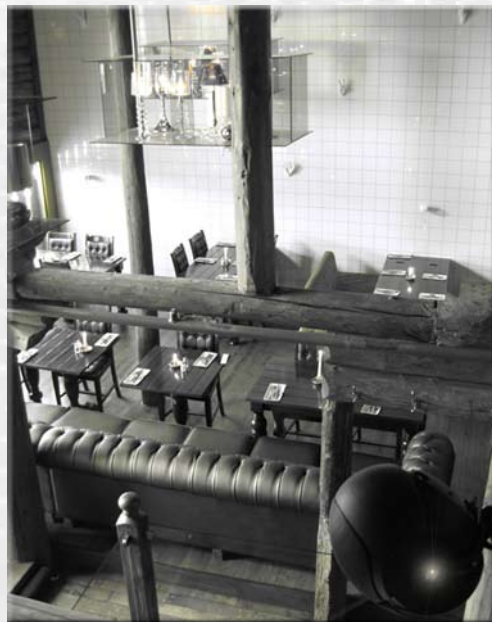
Ai Suma i Trondheim. Veldig diskrete høytaler-løsninger i tradisjonell brygge med hipt interiør.