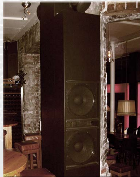
Bari i Trondheim. Spesialbygd basshøytaler tilpasset lokalets interiør og byggestil.