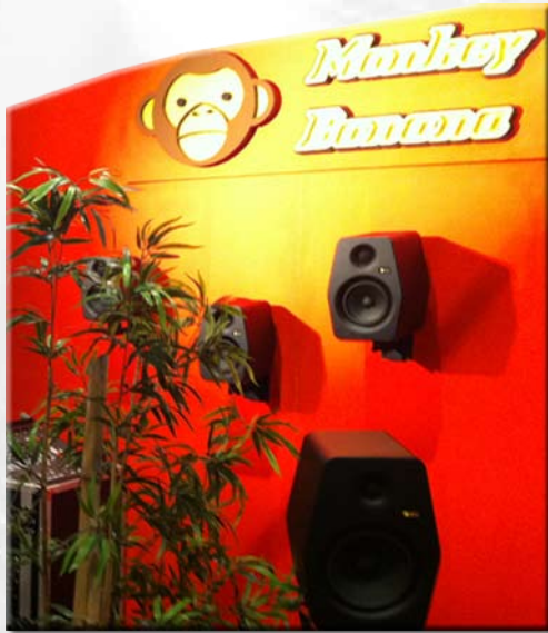
Monkey Banana er et nytt høyttaleragentur i Norge, og vi er stolte av å være eneleverandør av disse;-)