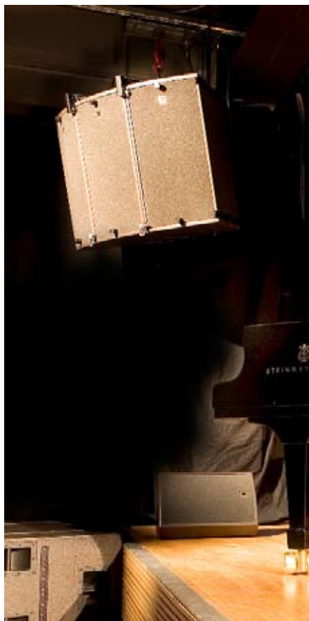
Installasjon av L'acoustics ARCS / SB218 / xta lydanlegg på oppdrag fra Scandec Systemer AS på Dokkhuset Scene oktober 2007.