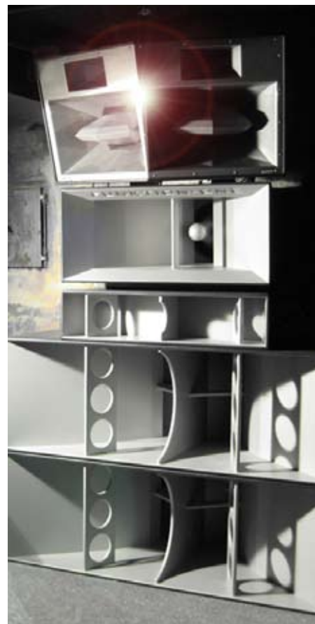
Spesialbygd Funktion-One Dancestack med MC2 forsterkere og xta prosessor installert oktober 2009 på SUPA (kjelleren til Brukbar).