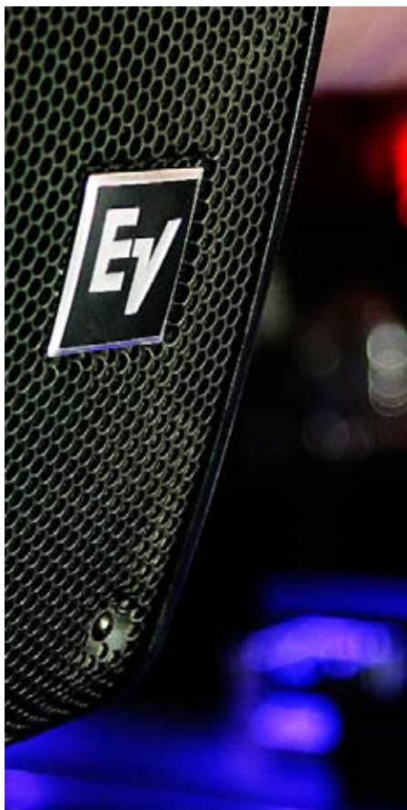
15KW Electro-Voice anlegg med 12stk CPS forsterkere og N8000 IRISNet prosessor installert over 3 etasjer på Gossip mai 2009.